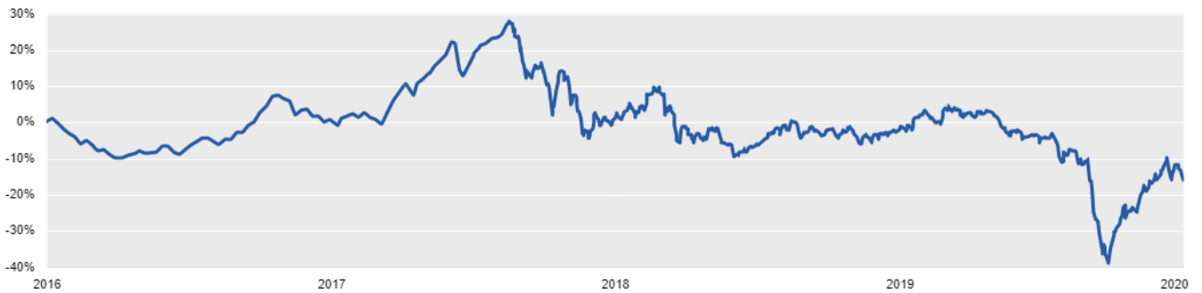
Performance Chart -USD-I-