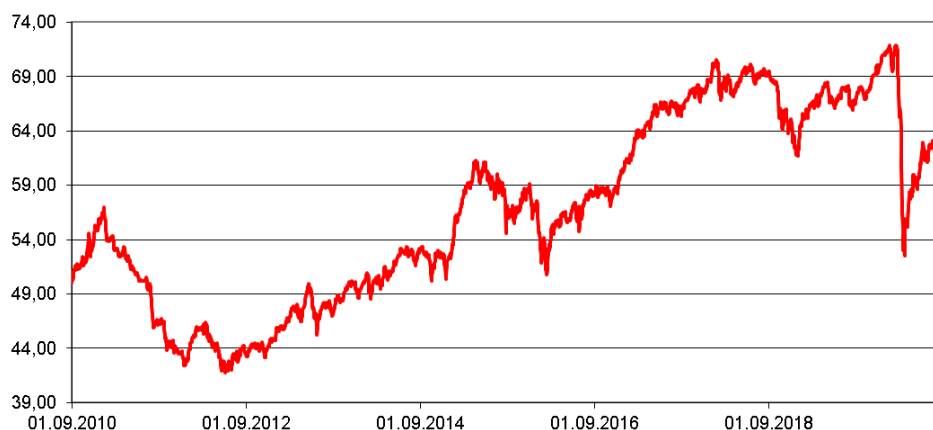
Entwicklung des Fondspreises (in €) Rücknahmepreise - um Ausschüttungen / Thesaurierungen bereinigt

Durchschnittliche Jahreswertentwicklung: