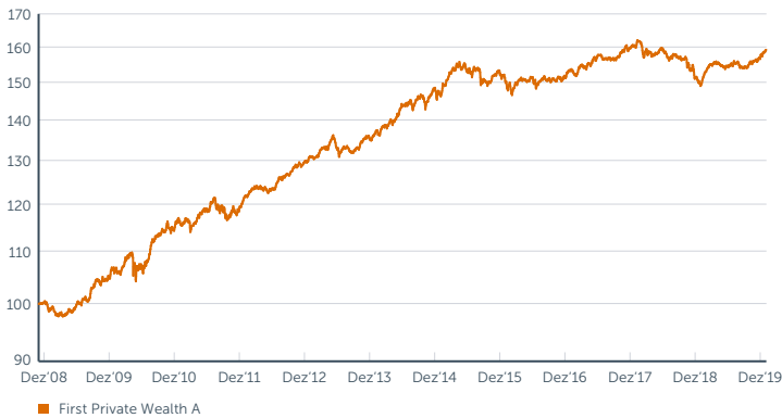
Wertentwicklung des First Private Wealth A seit Auflegung; Berechnung der Wertentwicklung nach BVI-Methode, d.h. ohne Berücksichtigung des Ausgabeaufschlages. Wertentwicklungen in der Vergangenheit sind kein verlässlicher Indikator für die zukünftige Wertentwicklung.